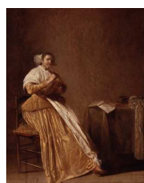
Fluitspelende vrouw, geschilderd door