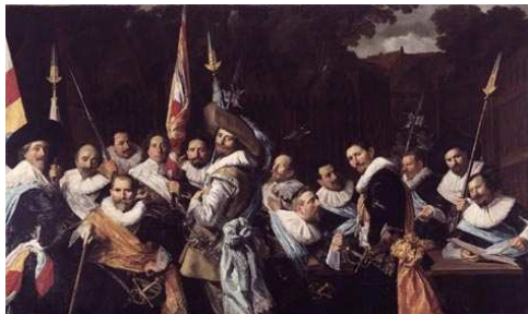
Vergadering van officieren en onder-officieren van de Cluveniersschutterij, 1633

Aan het hoofd van de schutterij stonden de officieren. Zij kwamen uit de hoogste kringen van de bevolking en werden voor drie jaar