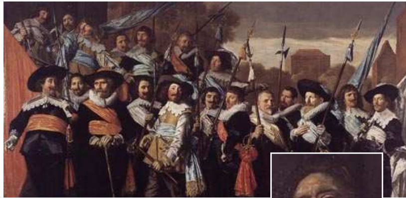
Officieren en onderofficieren van de Sint-Jorisschutterij, 1639