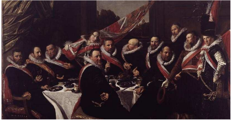
Schutters van de Sint-Jorisschutterij, 1616

In 1616 maakt Frans Hals zijn eerste grote groepsportret: het schuttersstuk van de Sint-Jorisschutterij. Tussen 1616 en 1639 schilderde Frans Hals in totaal zes schuttersstukken; vijf voor de Haarlemse schutterijen en een voor een Amsterdamse schutterij. Het laatste heeft hij nooit afgemaakt, dat heeft een andere schilder voor hem gedaan. De vijf schilderijen van de Haarlemse schutterijen hangen allemaal in het Frans Hals Museum.