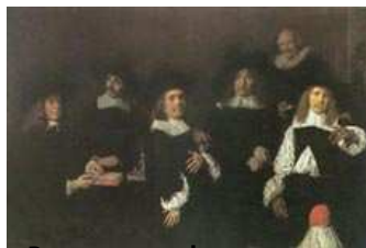
Regenten van het Oudemanshuis, 1664