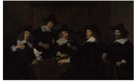
Regenten van het Sint-Elizabethsgasthuis, 1641.

In de negentiende eeuw waren de impressionisten helemaal weg van de manier van schilderen van Frans Hals, ze zagen hem als voorbeeld. Toen Vincent van Gogh een schilderij van Frans Hals zag, zei hij: “Wat is het een genot zo’n Frans Hals te zien, wat is het heel anders dan de schilderijen [...] waar zorgvuldig alles op dezelfde wijze is gladgestreken” . Als je bedenkt dat de impressionisten rond 1880 schilderden, zie je dat Frans Hals zijn tijd meer dan 200 jaar vooruit was! Maar ook in zijn eigen tijd was Frans Hals populair om zijn manier van schilderen.