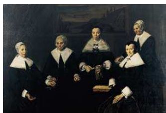
Regentessen van het Oudemanshuis, 1664