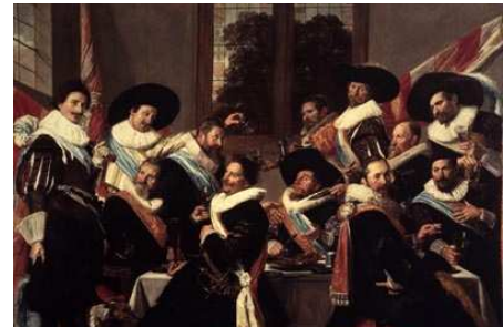
Maaltijd van de officieren van de Cluvenierschutterij, 1627

schuttersstukken van Frans Hals. Hiernaast zie je er daar één van.