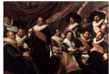
Maaltijd van de officieren van de Sint-Jorisschutterij, 1627

Het stadsbestuur benoemde de officieren van de schutterij. Er waren vijf rangen. Van laag naar hoog waren dat: vaandrig, luitenant, kapitein, fiscaal (penningmeester) en kolonel.